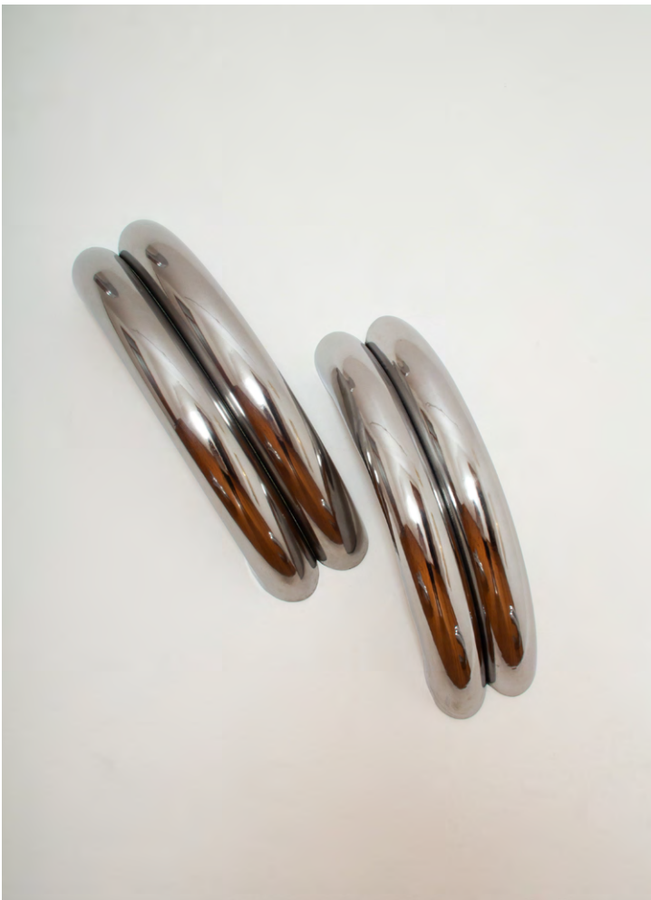
The Big Flow Two Piece Wall Installation Acero pulido hecho a mano Each: 85 x 21 x 22 cm