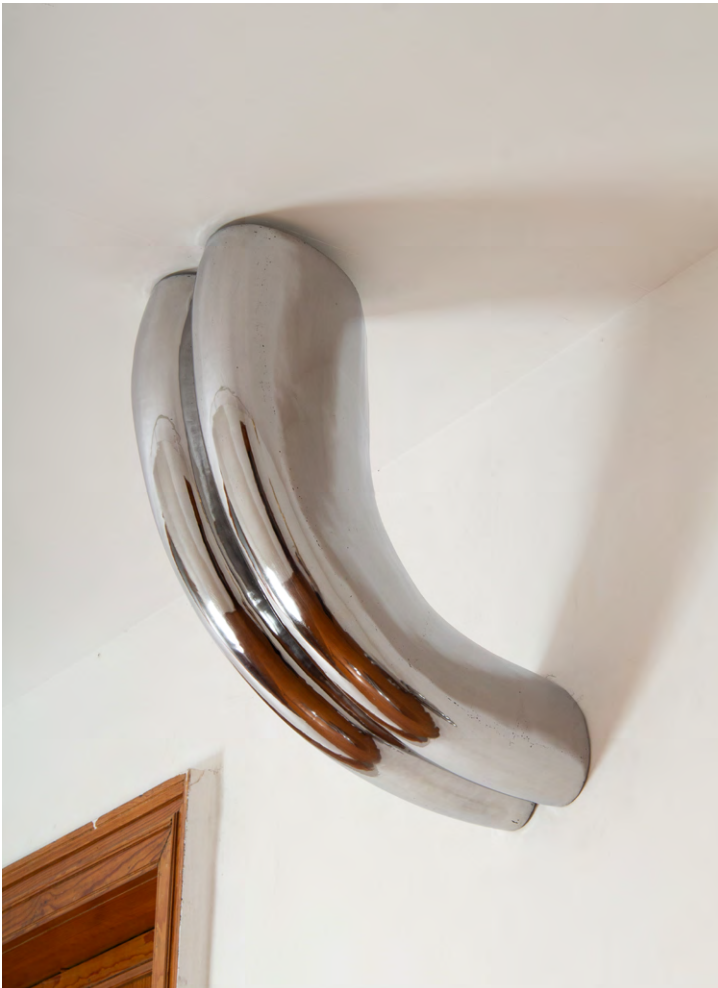
The Big Flow Ceiling to Wall Installation Acero pulido hecho a mano 64 x 61 x 44 cm