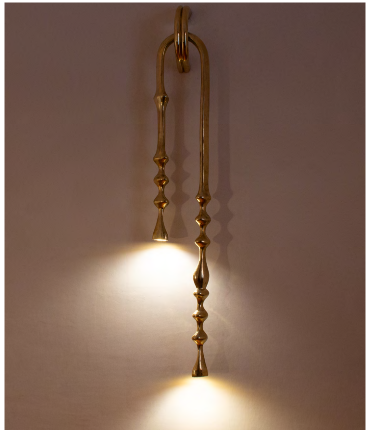
RIOLOVE Grande Pending Bronce fundido a la arena 245 x 35.5 x 12.3 cm