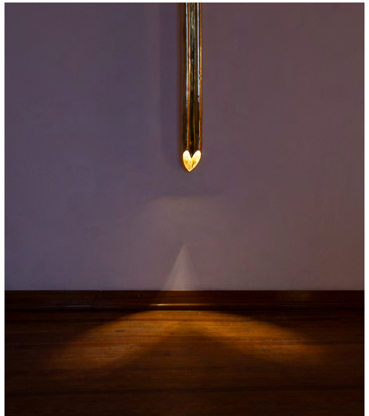
OTAGEP Earring Light Bronce fundido a la arena 206 x 34 x 22 cm